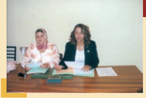
مؤطرتا مركز الإستماع الرئيسي عند إلقاءهما لإحدى الحملات النصف الشهرية