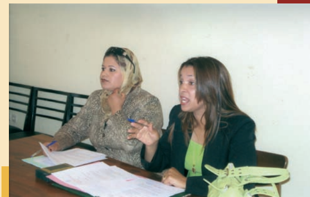
أطر مركز الاستماع الرئيسي أثناء قيامهما بإحدى الحملات التحسيسية

* التنسيق بين جميع مراكز الإستماع التابعة للاتحاد الوطني النسائي المغربي بأقاليم المملكة .