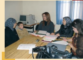
أطر مركز الإستماع الرئيسي أثناء زيارتهما لمراكز المملكة واستقبالهما لحالة ثبوت نسب