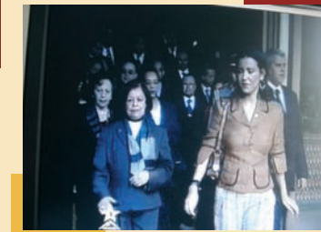
توقيع اتفاقية شراكة بين الاتحاد الوطني النسائي المغربي ووزارة العدل بحضور سمو الأميرة الجليلة للامريم