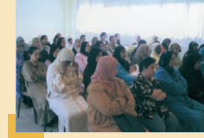
المستفيدات من حملات مركز الإستماع الرئيسي